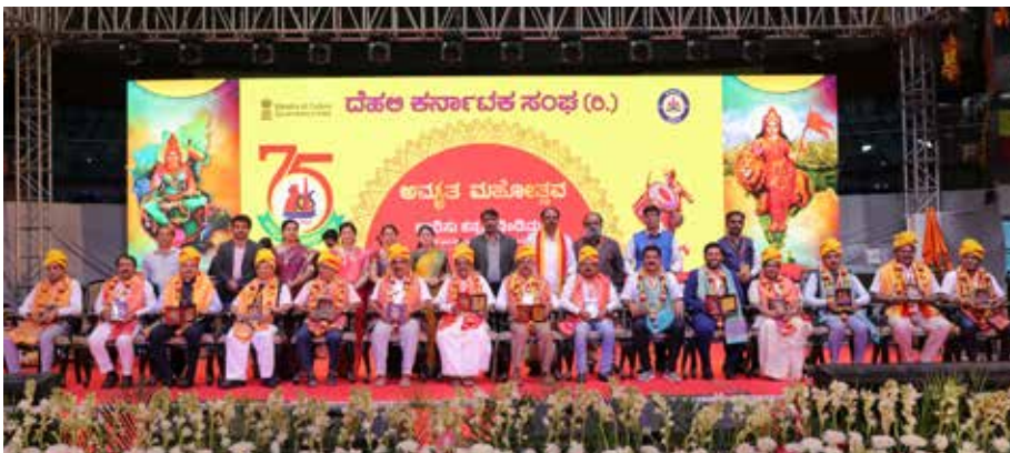
ದೇಹಲ ಕರ್ನಾಟಕ ಸಂಘಕ್ಕೆ ಅಪರಿಮಿತ ಸೇವೆ ಸಲ್ಲಿಸಿದವರನ್ನು, ಕೊಡುಗೆ ದಾನಿಗಳನ್ನು ಸನ್ಮಾನಿಸಿದ ಕ್ಷಣಗಳು