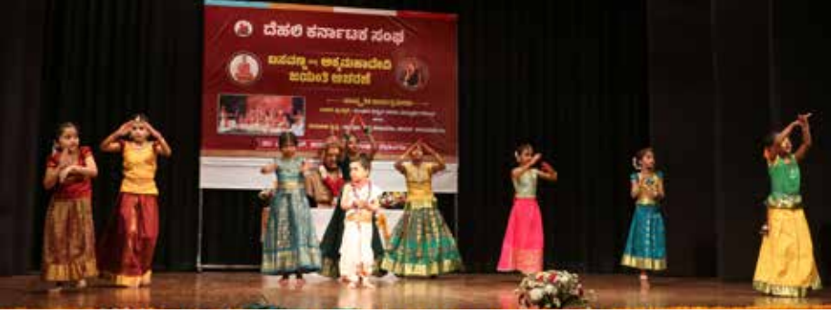
ಕನ್ನಡ ಮಕ್ಕಳಿಂದ ಸಮೂಹ ನೃತ್ಯ