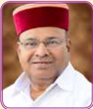
ಶ್ರೀ ಥಾವರ್‌ಚಂದ್ ಗೋಕುಲದಾಸ್