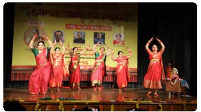
ಜನಕಪುರಿ ಮಹಿಳಾ ಮಂಡಳಿ