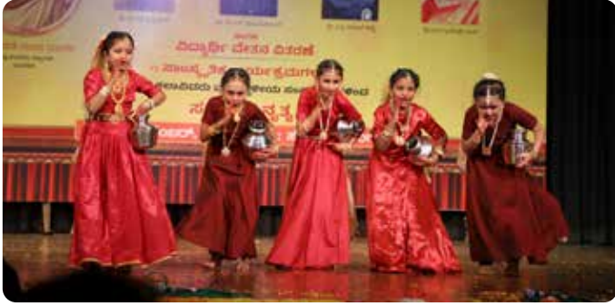
ದೇಹಲ ಕರ್ನಾಟಕ ಸಂಘ ಕಲಕಾ ಕೇಂದ್ರ ಜೂನಿಯರ್ಸ್ (ಮಕ್ಕಳು)