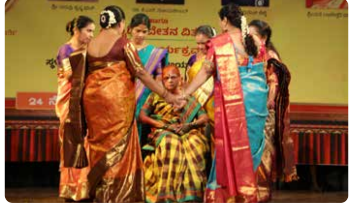
ಕಲ್ಯಾಣ ಕನ್ನಡಿಗರ ಸಾಂಸ್ಕೃತಿಕ ಸಮಿತಿ