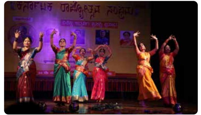
ಗುರುಗಾಂವ್ ಕನ್ನಡ ಸಂಘ