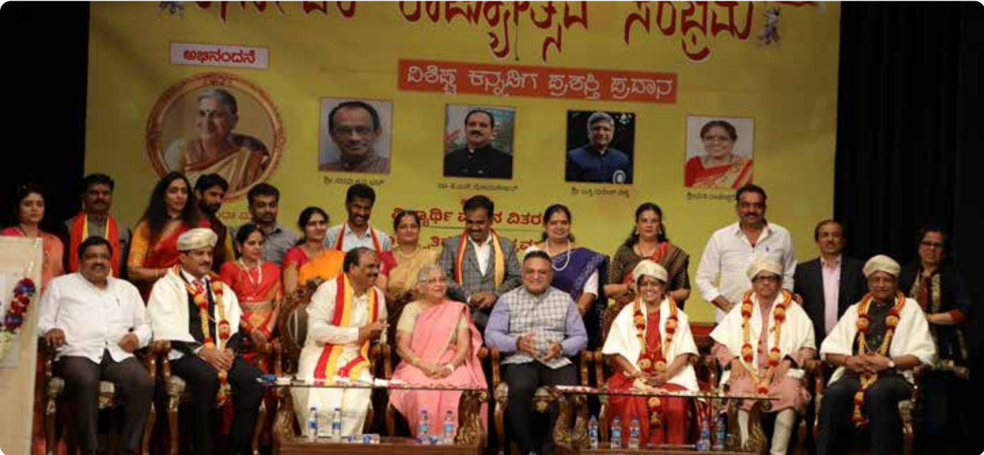
ಮುಖ್ಯ ಅತಿಥಿ ಶ್ರೀಮತಿ ಡಾ. ಸುಧಾ ಮೂರ್ತಿ, ವಿಶೇಷ ಅತಿಥಿ ಡಾ. ಕೆ.ಜಿ. ಶ್ರೀನಿವಾಸ ಹಾಗೂ ವಿಶಿಷ್ಟ ಕನ್ನಡಿಗ ಪ್ರಶಸ್ತಿ ಪುರಸ್ಕೃತರೊಂದಿಗೆ ಸಂಘದ ಪದಾಧಿಕಾರಿಗಳು ಮತ್ತು ಸದಸ್ಯರು.

ದೆಹಲಿ ಕರ್ನಾಟಕ ಸಂಘಕ್ಕೆ ಬಂದಿರುವುದು ನಮ್ಮ ಸೌಭಾಗ್ಯ. ಇಂದು ಸರಿ ಸುಮಾರು ಸಂಜೆ ನಾಲ್ಕು ಗಂಟೆಗೆ ಆರಂಭವಾಗಿ ಸತತ ನಾಲ್ಕು ಗಂಟೆಗಳ ಕಾಲ ನಡೆದಿರುವ ಈ ಕಾರ್ಯಕ್ರಮದಲ್ಲಿ ಸಭಾಂಗಣ ಕಿಕ್ಕಿರಿದು ತುಂಬಿದೆ. ಈ ಸಮಾರಂಭದಲ್ಲಿ ಕನ್ನಡಿಗರಿಗೆ ವಿಶೇಷವಾದ ಸೇವೆ ಸಲ್ಲಿಸಿರುವ ದೆಹಲಿ ಕನ್ನಡಿಗರನ್ನು ಗುರುತಿಸಿ ವಿಶಿಷ್ಟ ಕನ್ನಡಿಗ ಪ್ರಶಸ್ತಿ ನೀಡಿದ್ದೇವೆ, ಹಾಗೇನೇ, 57 ಕನ್ನಡಿಗರ ಮಕ್ಕಳಿಗೆ ಮತ್ತು 7 ಸಂಘದ ಸಿಬ್ಬಂದಿ ಮಕ್ಕಳಿಗೆ ಅವಶ್ಯಕತೆ ಆಧಾರದ ಮೇಲೆ ಹಾಗೂ 17 ಮಕ್ಕಳಿಗೆ ಅರ್ಹತೆ ಆಧಾರದ ಮೇಲೆ ಒಟ್ಟಾರೆ 81 ಮಕ್ಕಳಿಗೆ ಈ ಬಾರಿ ವಿದ್ಯಾರ್ಥಿ ವೇತನ ವಿತರಣೆ ಮಾಡ್ತಾ ಇದ್ದೇವೆ. ಮುಖ್ಯ ಅತಿಥಿಗಳಾಗಿ ಬಂದಿರುವ ಡಾ. ಸುಧಾ ಮೂರ್ತಿ ಅಮ್ಮನವರು ಈ ಹಿಂದೆ ನಮ್ಮ 50000 ಪುಸ್ತಕಗಳಿರುವ ಗ್ರಂಥಾಲಯಕ್ಕೆ 10 ಲಕ್ಷ ರೂಪಾಯಿ ಹಾಗೂ ಇತ್ತೀಚೆಗೆ ನೀಡಿದ 60