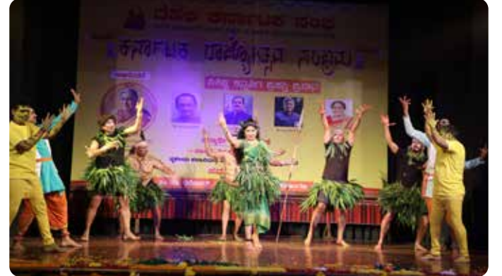
ಶ್ರೀಗಣೇಶ ಮಿತ್ರ ಮಂಡಳಿ