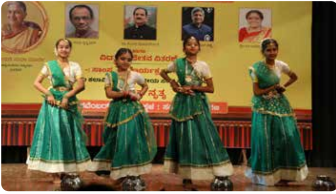
ಅಜಲ ಭಾರತ ಶರಣ ಸಾಹಿತ್ಯ ಪರಿಷತ್ತು (ಮಕ್ಕಳು)