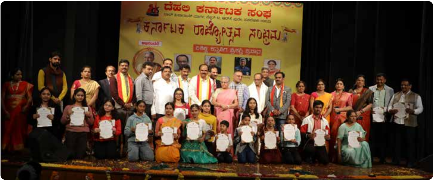
ಗಣ್ಯರೊಂದಿಗೆ ಅರ್ಹತೆ ಆಧಾರದ ಮೇಲೆ ವಿದ್ಯಾರ್ಥಿ ವೇತನ ಪಡೆದ ಮಕ್ಕಳು

ಲಕ್ಷ ರೂಪಾಯಿ ದೇಣಿಗೆ ಸೇರಿ, ಒಟ್ಟು 70 ಲಕ್ಷ ರೂಪಾಯಿಗಳನ್ನು ನಮ್ಮ ಸಂಘಕ್ಕೆ ಕೊಡುಗೆಯಾಗಿ ನೀಡಿದ್ದಾರೆ. ಅವರಿಗೆ ಕೃತಜ್ಞತೆಗಳು ಎಂದರು.