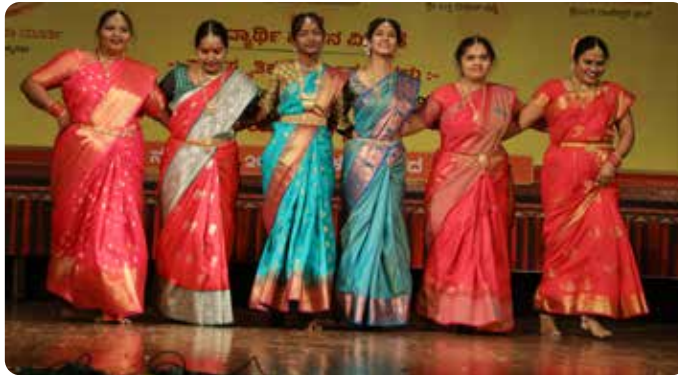
ಗುರುಗಾಂವ್ ಕನ್ನಡ ಸಂಘ : ಗ್ರೂಪ್ 1