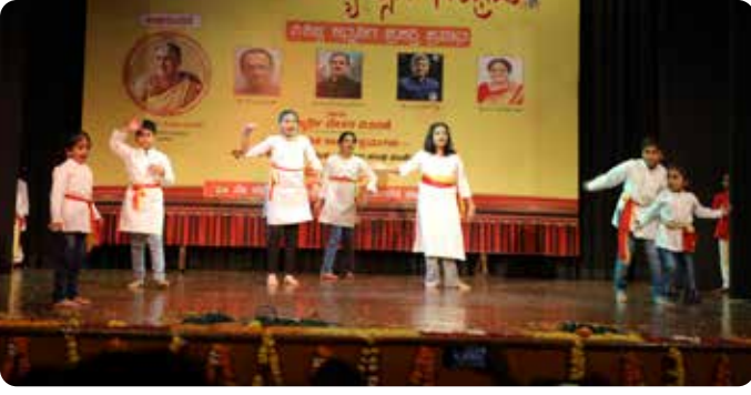
ದೇಹಲ ಒಕ್ಕಲಗ ಗೌಡ ಸಂಘ (ಮಕ್ಕಳು)