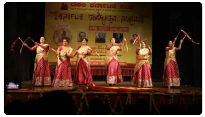
ದೆಹಲಿ ಪೋಲಿಸ್ ಕನ್ನಡಿಗರ ಕಲ್ಯಾಣ ಸಮಿತಿ