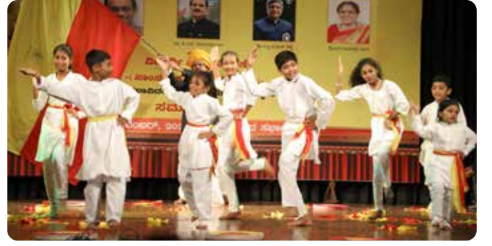
ದೇಹಲ ಕನ್ನಡ ಹಿರಿಯ ಮಾಧ್ಯಮಿಕ ಶಾಲೆ