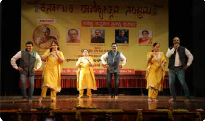
ಜನಕಪುರಿ ಕನ್ನಡ ಕೂಟ