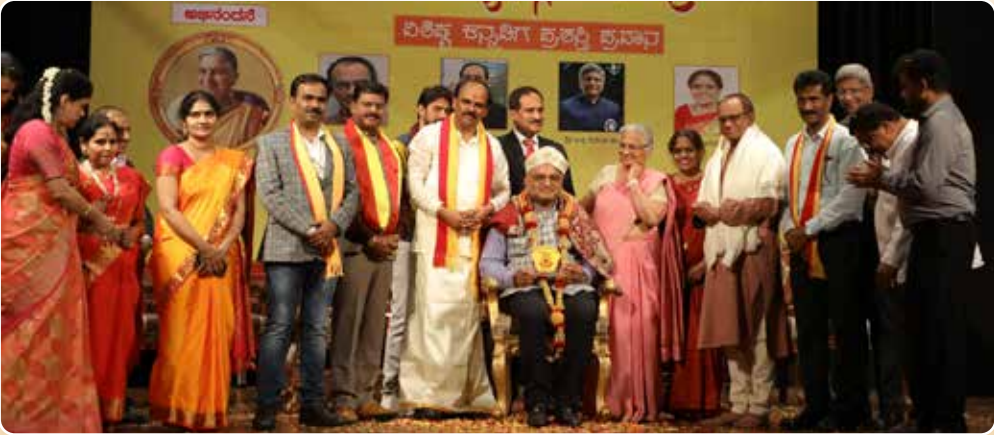
ಮುಖ್ಯ ಅತಿಥಿ ರಾಜ್ಯಸಭಾ ಸಂಸದ ಶ್ರೀಮತಿ ಡಾ. ಸುಧಾಮೂರ್ತಿ ಅವರನ್ನು ಗೌರವಿಸಿ ಅಭಿನಂದಿಸಿದ ದೃಶ್ಯ