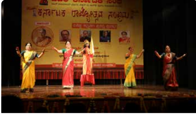
ನೈಹಾ ದೆಹಲಿ ಕನ್ನಡ ಲೇಡೀಸ್ ಅಸೋಸಿಯೇಷನ್