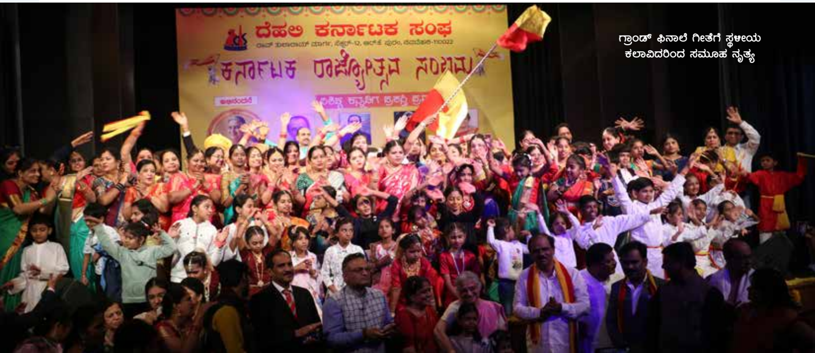
ಗ್ರಾಂಡ್ ಫಿನಾಲೆ ಗೀತೆಗೆ ಸ್ಥಳೀಯ ಕಲಾವಿದರಿಂದ ಸಮೂಹ ನೃತ್ಯ