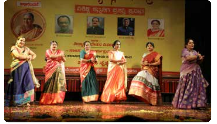
ದೆಹಲಿ ಒಕ್ಕಲಗ ಗೌಡ ಸಂಘ