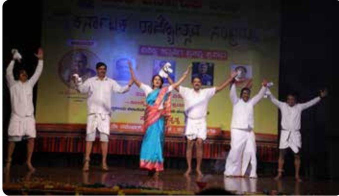
ದೆಹಲಿ ಫ್ರೆಂಡ್ಸ್ ತಂಡ