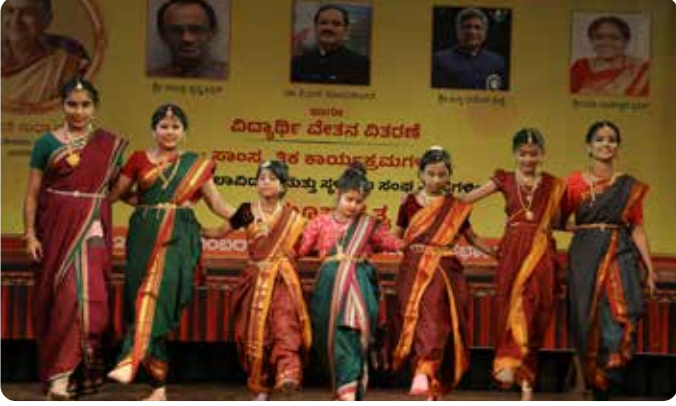
ಭವಾಡಿ ಕನ್ನಡ ಸಂಘ (ಮಕ್ಕಳು)