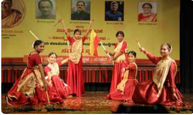
ದೆಹಲಿ ಕರ್ನಾಟಕ ಸಂಘ ಕನ್ನಡ ಕಲಕಾ ಕೇಂದ್ರ