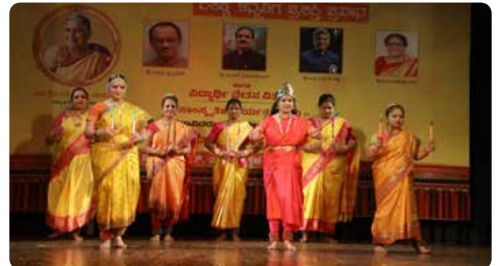
ಅಜಲ ಭಾರತ ಶರಣ ಸಾಹಿತ್ಯ ಪರಿಷತ್ತು