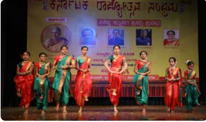
ಶ್ರೀನಿವಾಸಪುರಿ ಕನ್ನಡ ಕಲಕಾ ಕೇಂದ್ರದ ಮಕ್ಕಳು