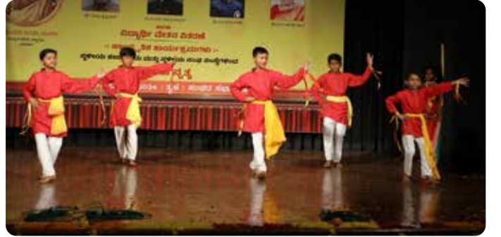
ಶ್ರೀನಿವಾಸಪುರಿ ಕಲಕಾ ಕೇಂದ್ರ (ಹುಡುಗರು)