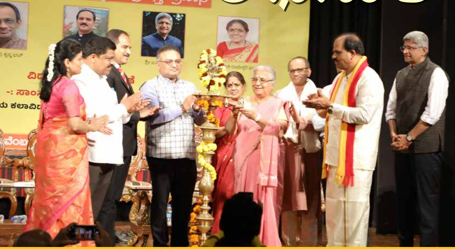
ಸಂಘದಲ್ಲಿ 'ಕರ್ನಾಟಕ ರಾಜ್ಯೋತ್ಸವ ಸಂಭ್ರಮವನ್ನು' ದೀಪ ಪ್ರಜ್ವಲಿಸಿ ರಾಜ್ಯಸಭಾ ಸಂಸದೆ ಶ್ರೀಮತಿ ಡಾ. ಸುಧಾ ಮೂರ್ತಿ ಅವರು ಉದ್ಘಾಟಿಸಿದ ಅವಿಸ್ಮರಣೀಯ ಕ್ಷಣ