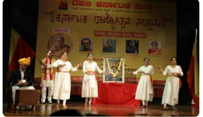
ದೆಹಲಿ ಕನ್ನಡ ಶಿಕ್ಷಣ ಸಂಘ