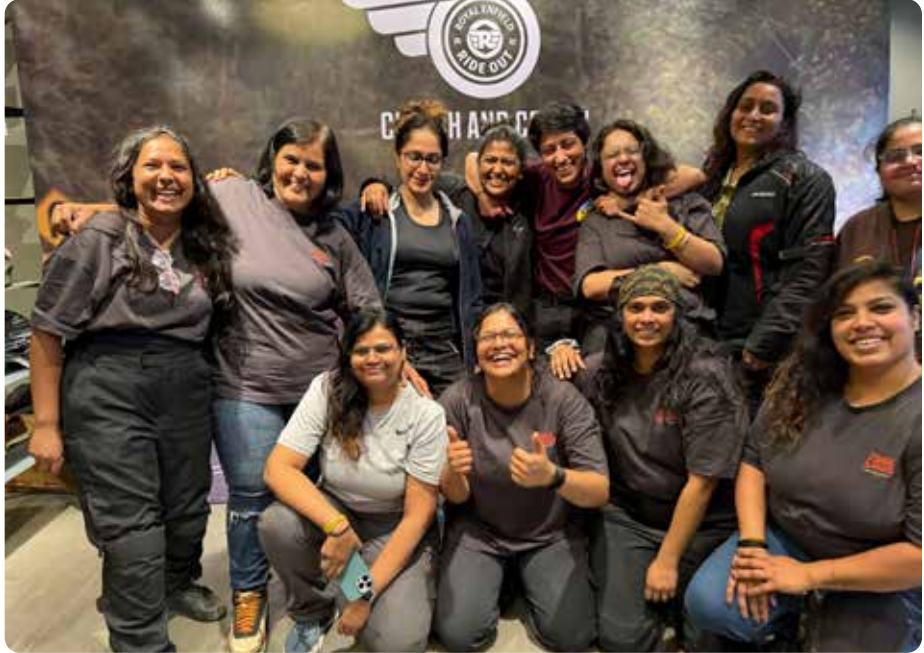
ಕ್ಲಬ್ ಮತ್ತು ಕೌನ್: ದ್ವಿಚಕ್ರದ ಜೊತೆ ಬಾಂಧವ್ಯ

ಬೆಳಿಗ್ಗೆ 4:30 ರ ಹೊತ್ತಿಗೆ, ನಾವು 25 ಮಂದಿ ಇನ್ನೂ ಕತ್ತಲೆಯಾದ ಆಕಾಶದ ಕೆಳಗೆ ಒಟ್ಟುಗೂಡಿದೆವು. ನಮ್ಮ ಸರಕುಗಳು ಮತ್ತು ಹೆಸರಿನ ಟ್ಯಾಗ್‌ಗಳನ್ನು ಸಂಗ್ರಹಿಸಿದೆವು. ಅಪರಿಚಿತರಾಗಿದ್ದರೂ ಸಹ ಒಬ್ಬರನ್ನೊಬ್ಬರು ಪರಿಚಯಿಸಿಕೊಳ್ಳಲು ಪ್ರಯತ್ನಿಸಿದೆವು.